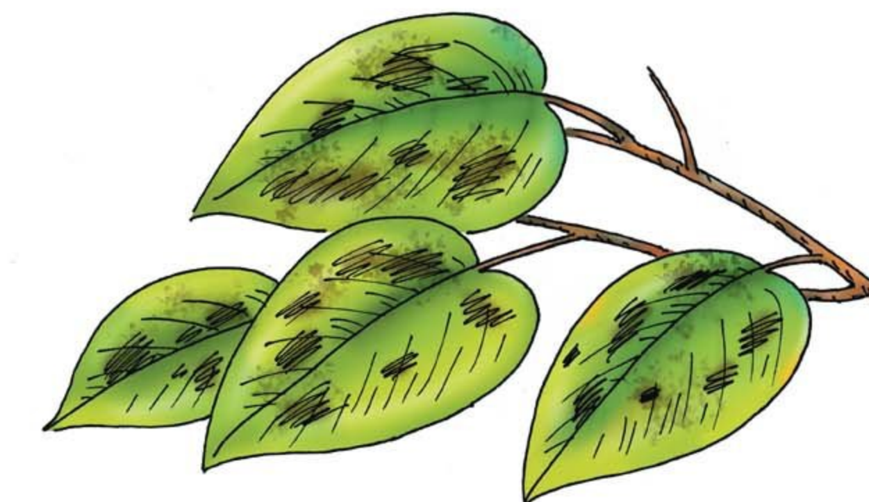
• поражения сельскохозяйственных растений болезнями и вредителями