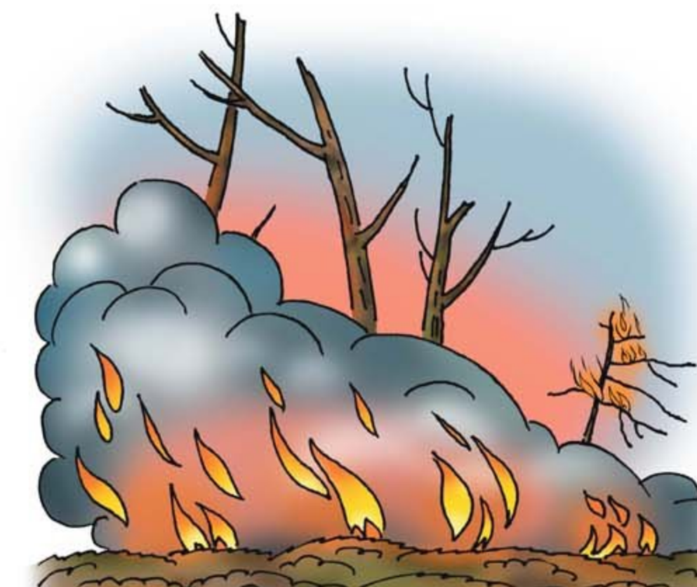
• природные пожары