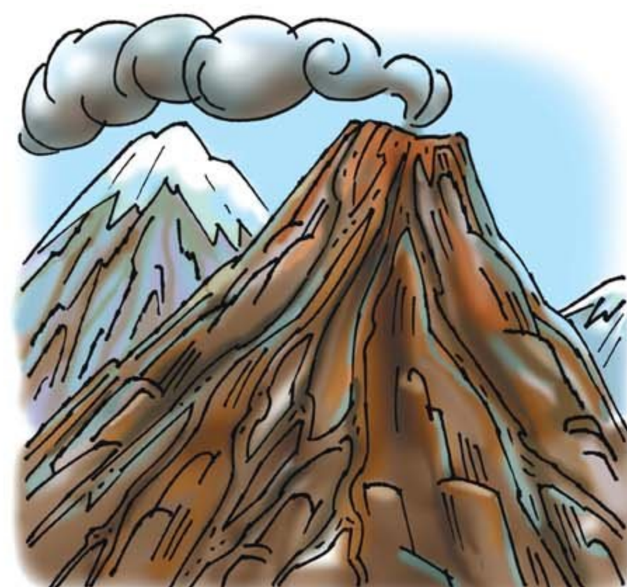
• опасные геологические явления и процессы

Возникают в результате опасного природного явления или стихийного бедствия, которое может повлечь или повлечло за собой человеческие жертвы, значительные материальные потери и нарушения условий жизнедеятельности, нанести ущерб здоровью людей или окружающей природе. К природным чрезвычайным ситуациям относятся опасные геологические, гидрологические, метеорологические явления и процессы, а также природные пожары.