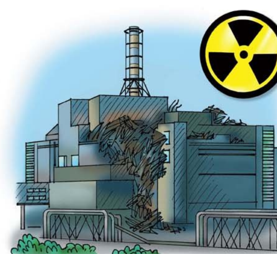
• аварии с выбросом радиоактивных веществ