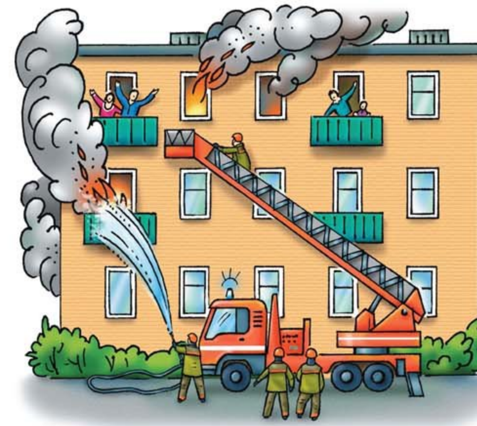
• пожары, взрывы