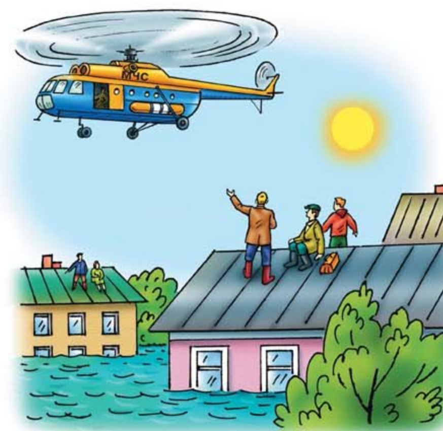
• опасные гидрологические явления и процессы