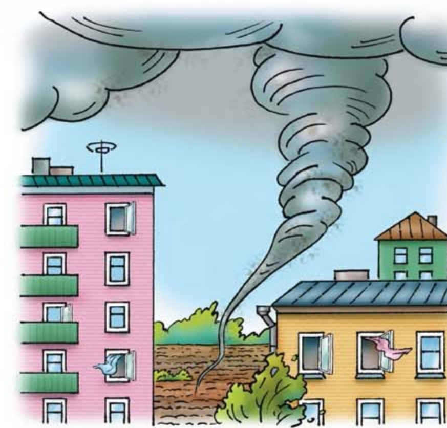
• опасные метеорологические явления и процессы