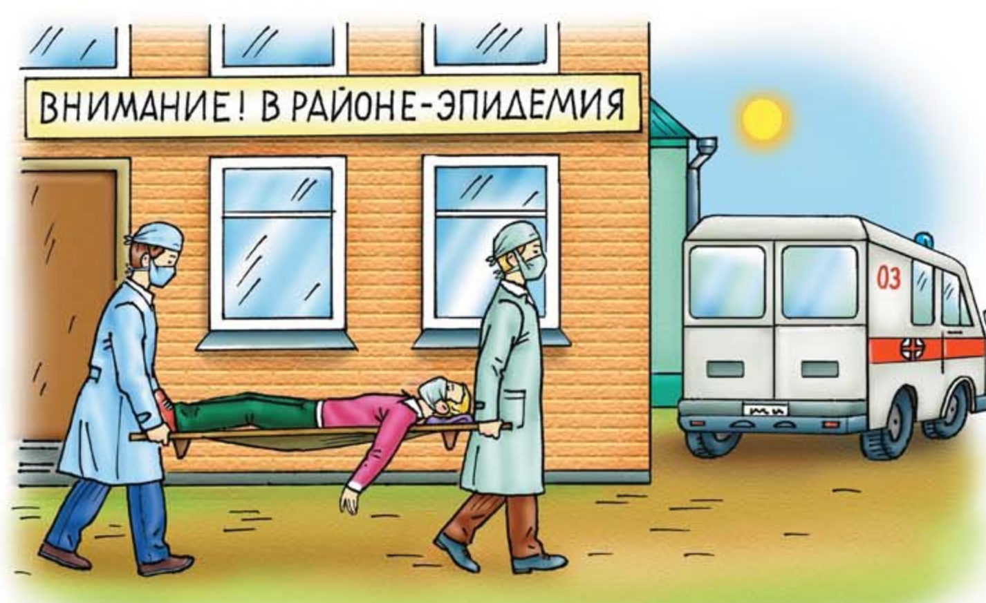
• инфекционная заболеваемость людей

Возникают в результате широкого распространения инфекционных болезней людей, сельскохозяйственных животных и растений, когда нарушаются нормальные условия жизнедеятельности, возникает угроза жизни и здоровью людей, происходит падеж скота и гибель растений.