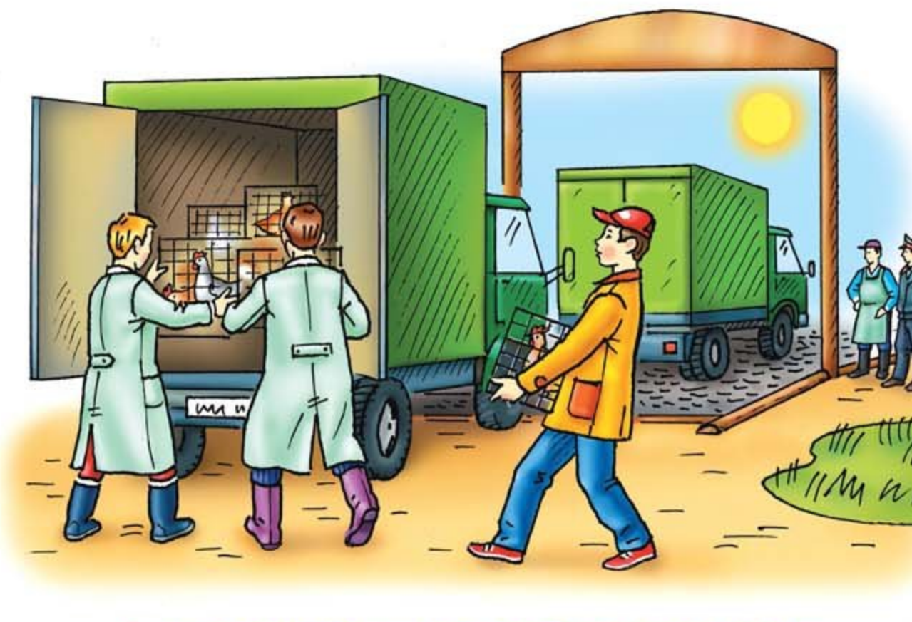
• инфекционная заболеваемость сельскохозяйственных животных