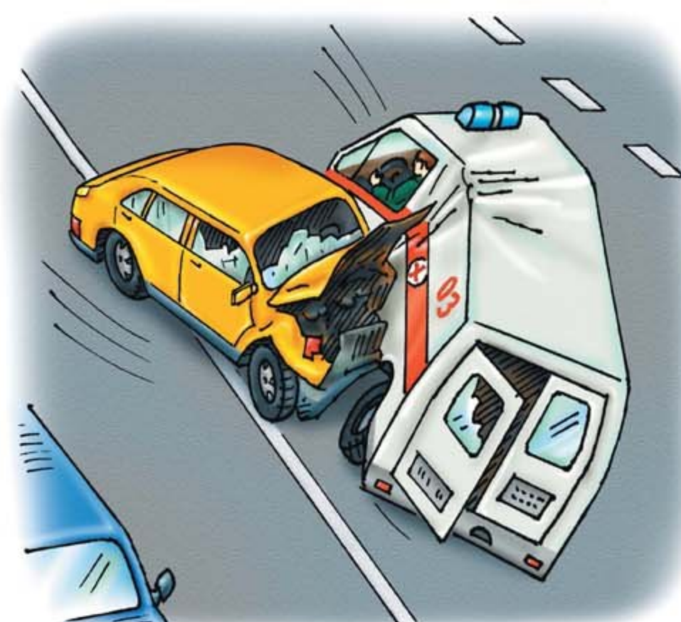
• транспортные катастрофы

Возникают в результате аварии или опасного техногенного происшествия, которое может повлечь или повлечло за собой человеческие жертвы, ущерб здоровью людей или окружающей природной среде, значительные материальные потери и нарушение условий жизнедеятельности. К техногенным чрезвычайным ситуациям относятся транспортные катастрофы, пожары, взрывы, аварии с выбросом радиоактивных веществ, гидродинамические аварии.